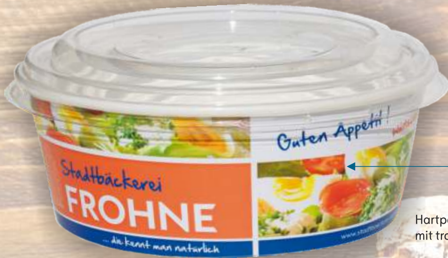
Hartpapierbecher „salad to go“ mit transparentem Deckel

Wir liefern Ihnen die dafür passende Verpackung, gerne mit Ihrem Werbedruck!