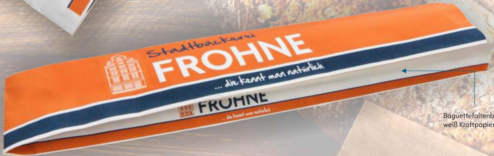
Baguettefaltenbeutel weiß Kraftpapier

Einschlagpapier bieten wir Ihnen auf Secare Rollen in Breiten von 30 und 50 cm, in den Qualitäten weiß gebleicht Kraft und braun Natronkraft, ab 12 Rollen à 10 kg, mit bis zu vier Farben.