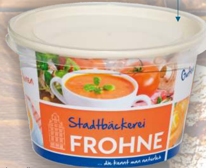
Hartpapierbecher „soup to go“ mit transparentem Deckel