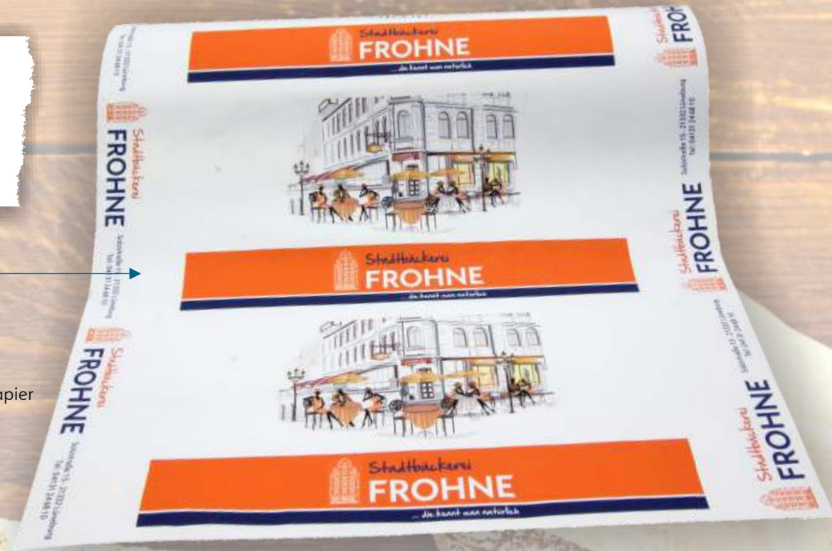
Secare Rolle 50 cm breit weiß Kraftpapier