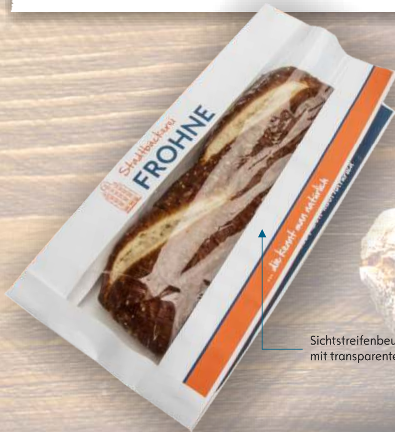
Sichtstreifenbeutel, weiß Kraftpapier mit transparentem PP-Sichtfenster

Baguettefaltenbeutel aus weiß gebleicht Kraft oder braun Natron sind in mehreren Standardgrößen ab einer Auflage von 12.000 Stück mit individuellem Druck lieferbar.