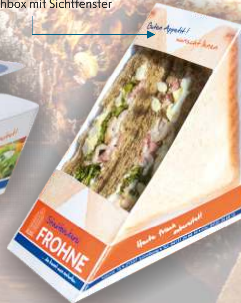
Sandwichbox mit Sichtfenster