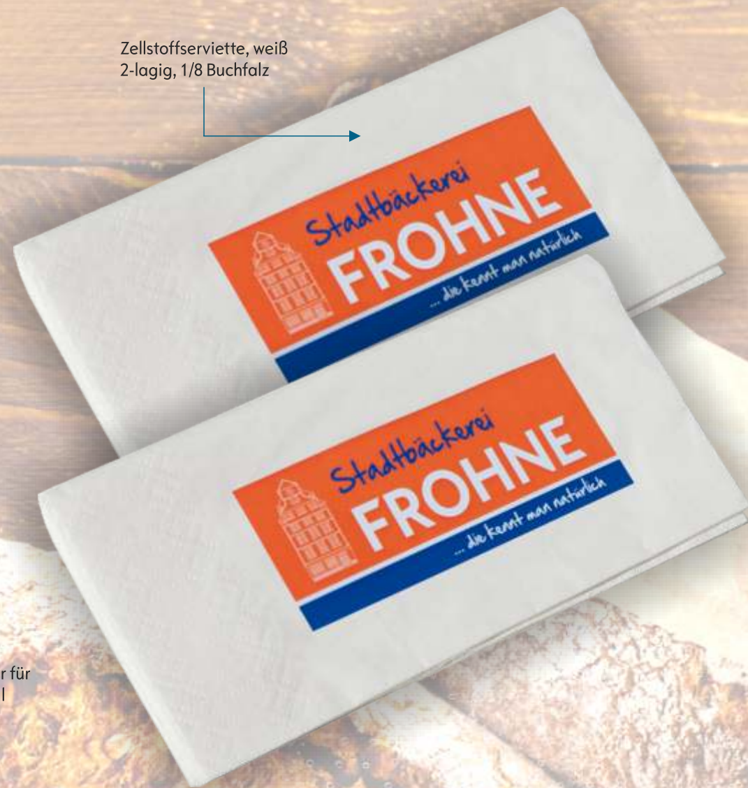
Zellstoffserviette, weiß 2-lagig, 1/8 Buchfalz