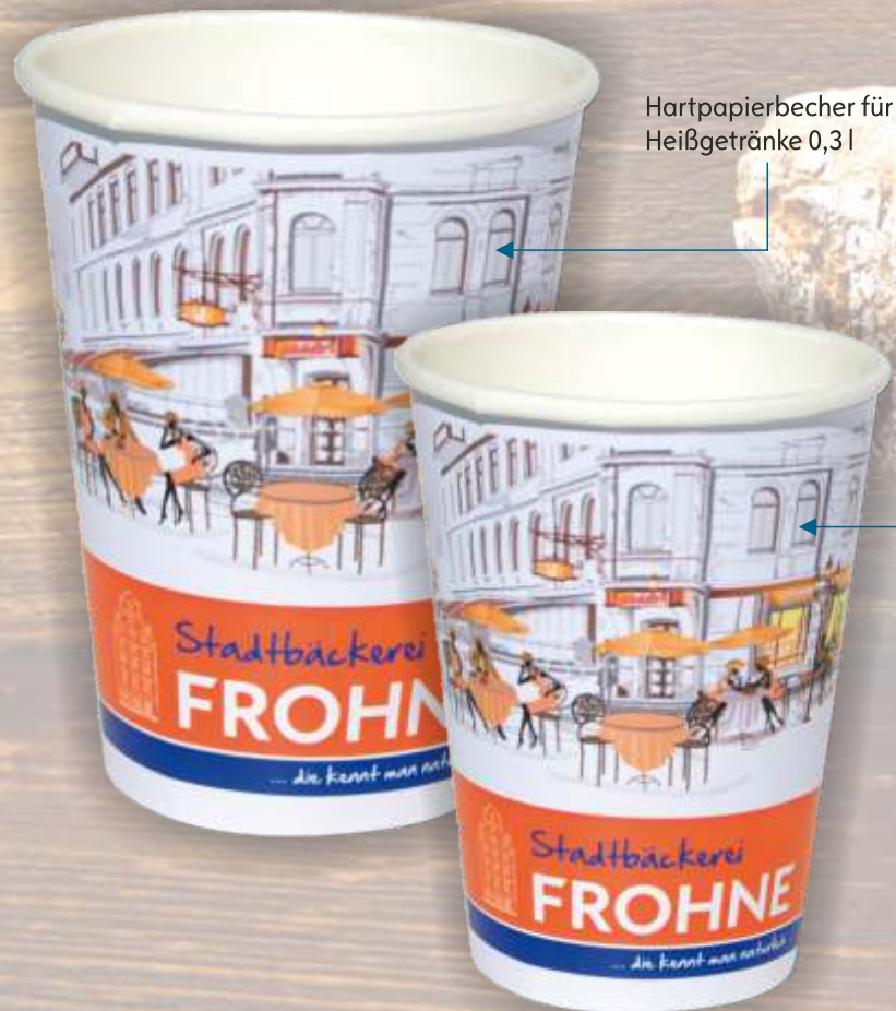
Hartpapierbecher für Heißgetränke 0,3l

Mit Ihrem Werbedruck produzieren wir diese Becher bereits ab einer Auflage von 25.000 Stück.