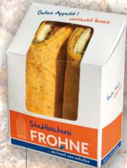
Wrapbox mit Sichtfenster